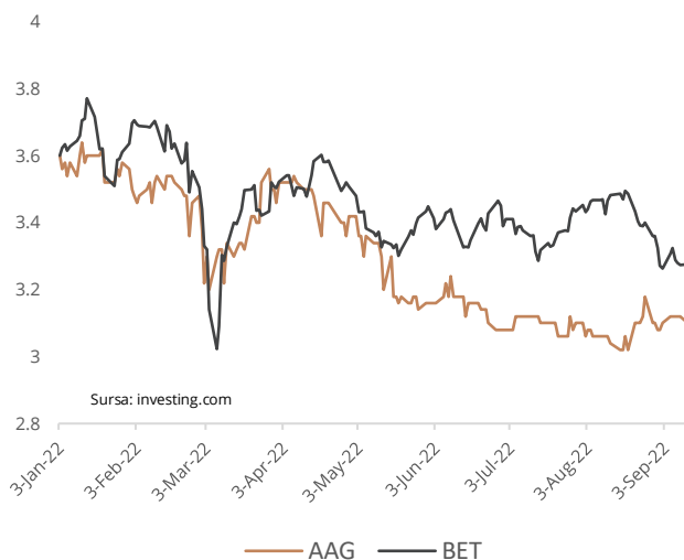
Evoluție preț AAG

În urma actualizării analizei companiei AAGES S.A. am stabilit un preț-țintă pentru următoarele 12 luni cuprins în intervalul 3,7-3,78 lei/acțiune. Creșterea prețului-țintă de la valoarea stabilită anterior (3,43-3,59) are la bază rezultatele financiare aferente celui de al treilea trimestru al anului 2022.